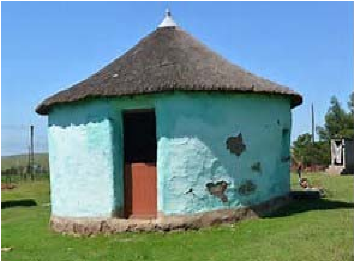
Sethalwa sa 14: Morale Motsemagaeng wa Morapalala kua GaModjadji, Masepaleng wa Greater Tzaneen, Seterekeng sa Mopani, Porofentsheng ya Limpopo (15 Pherekong 2017).