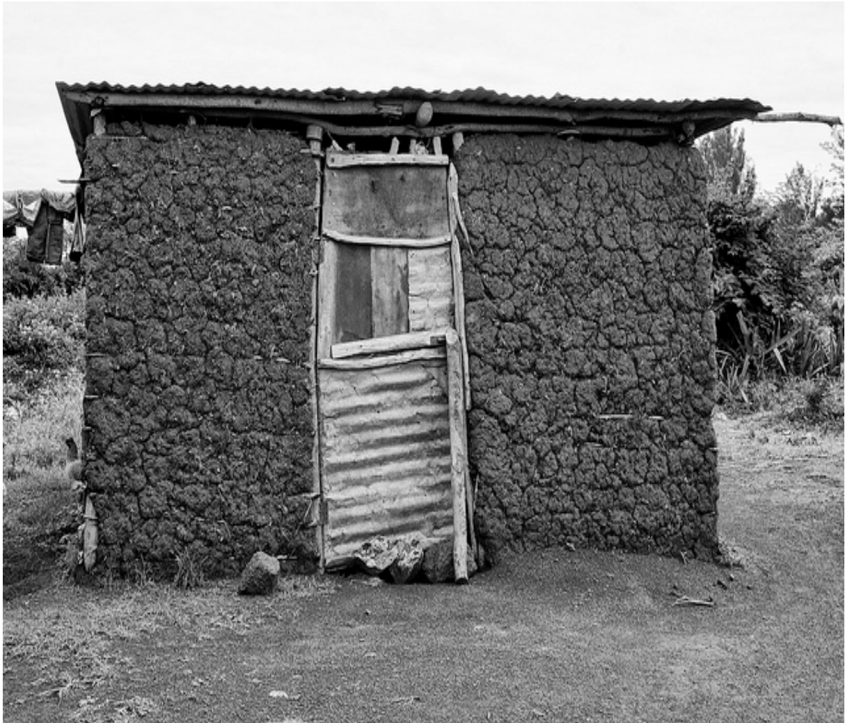
Sethalwa sa 17: Moago wa kgale kua Motsemagaeng wa Leretjeng, Masepaleng wa Greater Letaba, Seterekeng sa Mopani, Porofentsheng ya Limpopo (15 Pherekgong 2017).

Moago wa yona o amana le Dipalo ka lebaka la gore ke khutlonne le ge dikhutlo tše pedi tša ka morago di sa bonale. Go bonala lebati le dutše gare ga mahlakore a go lekana. Le ge polata ya gona e se ya rulelwa ka bothakga, masenke a gona a bonala a ruletše ntlo ya go ba le dikhutlo tše nne. Ka mkgwa wo polata ye e agilwego ka wona, go laetša gabotse gore taba ya go šoma ka Dipalo ke ya kgale. Go laetša gore moagi goba baagi ba yona ba be ba tseba gore ba dira eng. Ba hlhlantšhitše masenke gore ba se rulele mo go sa nyakegego.